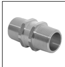
ADAPTATEUR 797 MALE A MALE