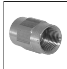
ADAPTATEUR 797 FEMELLE A FEMELLE